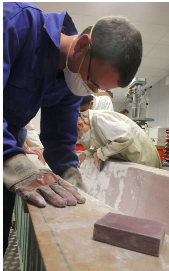
Pose de mastic et ponçage deviennent les activités principales des soirées de l'équipe.