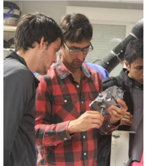
Dans les entrailles d'un moteur...